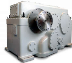
Wyskoobrotowa przekładnia GESE