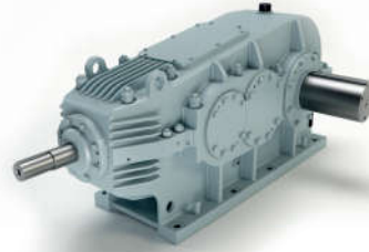
Przekładnia do napędu przenośników taśmowych

Przekładnie stożkowo-walcowe do napędów przenośników taśmowych