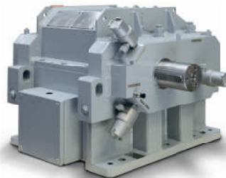
Wyskoobrotowa przekładnia RSB 250

Przekładnie wyskoobrotowe do 60 MW do turbin gazowych i parowych Generatory Napędy dmuchaw wirnikowych Napędy turbosprężarek Napędy pomp Przekładnie obracające rotor