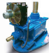
Przekładnia typu SK400 do chłodni kominowych