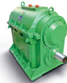
Przekładnia do wentylatorowych młynów węglowych