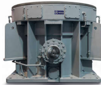
Przekładnia VMH do młynów pionowych

Jednostopniowa przekładnia skośna do wentylatorowego młyna węglowego Przekładnie skośne serii ZTE do napędów mokrych młynów kulowych Kruszarka żużłu